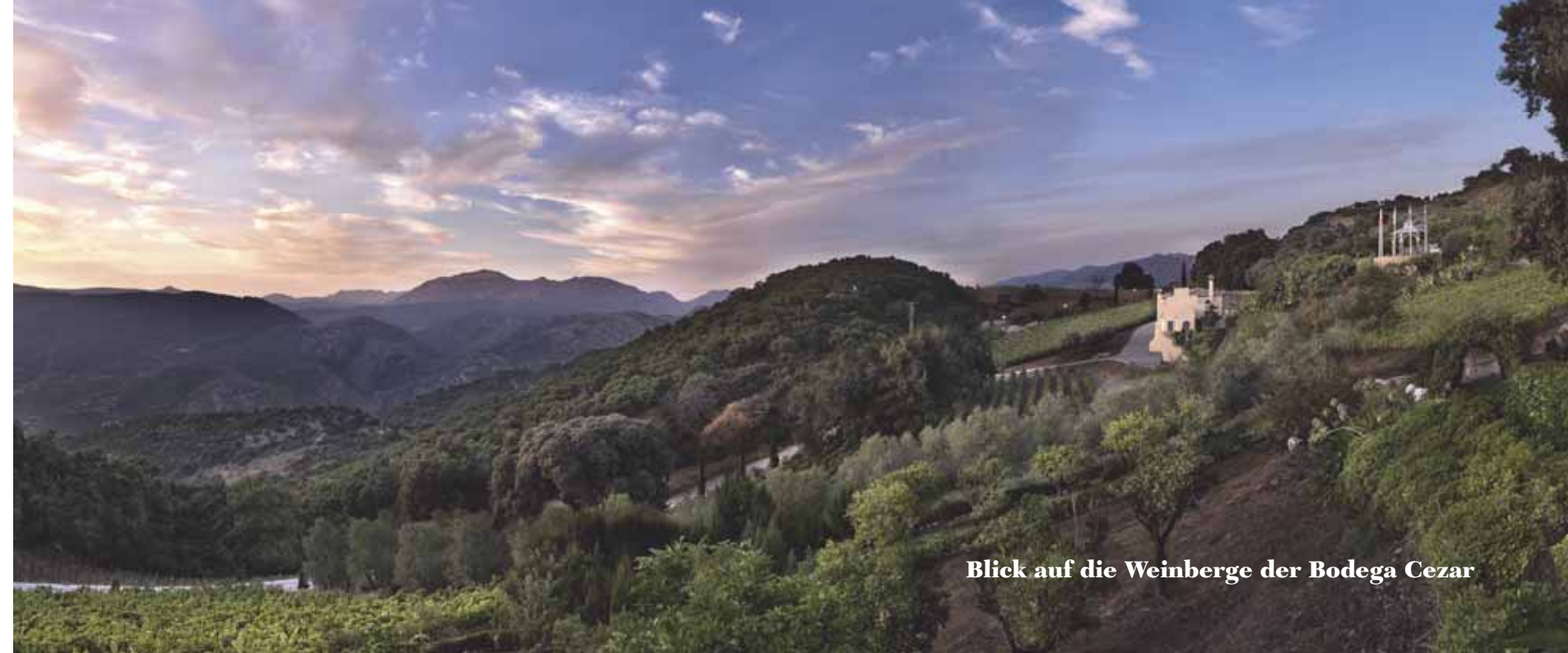
Blick auf die Weinberge der Bodega Cezar

Crème brûlée vom Stanser-Fladä mit Birnen-Pfeffersorbet und Mandeln